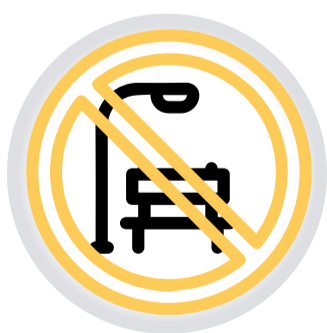
Indebida OCUPACIÓN DEL ESPACIO PÚBLICO