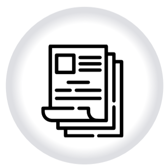
Radicación de documentos PARA TRÁMITES ANTE LOCALIDADES Y NIVEL CENTRAL