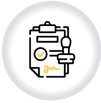
Permiso ESPECTÁCULOS PÚBLICOS DIFERENTES DE LAS ARTES ESCÉNICAS