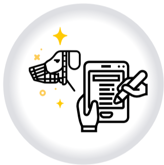
Registro EJEMPLARES CANINOS DE MANEJO ESPECIAL