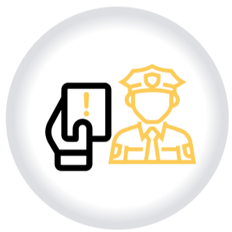
Registro OBJECIONES A COMPARENDOS CNSCC