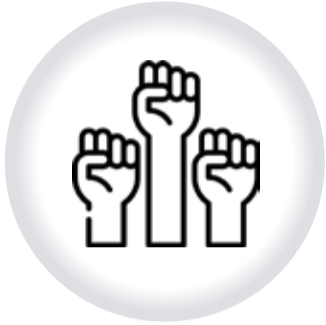
Protección para DEFENSORES DE DERECHOS HUMANOS