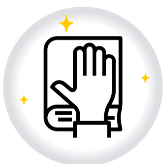
Juramento COLOMBIANO POR ADOPCIÓN