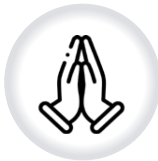
Plataforma INTERRELIGIOSA PIRPAS