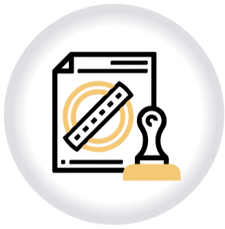
Autorización REALIZACIÓN DE CONCURSOS