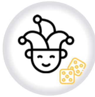
Juegos CONCURSOS Y ESPECTÁCULOS