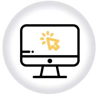
Ventanilla Virtual de RADICACIÓN CORRESPONDENCIA