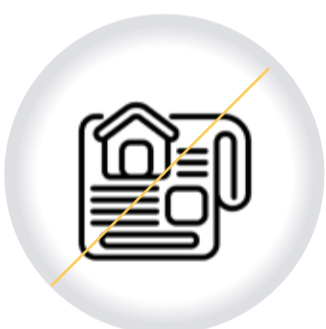
Extinción de la PROPIEDAD HORIZONTAL