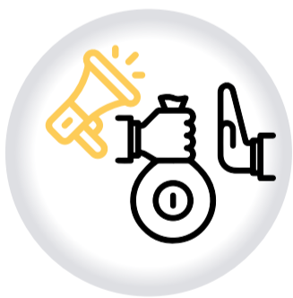
Denuncia cualquier ACTO DE CORRUPCIÓN