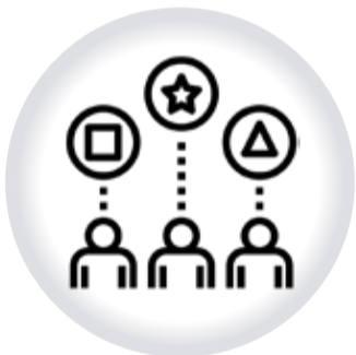
Portal Étnico de ATENCIÓN