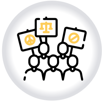
Marchas MANIFESTACIONES Y CONCENTRACIONES