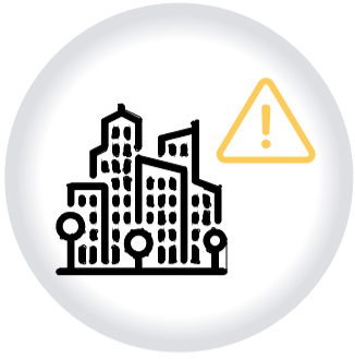
Infracciones al RÉGIMEN DE OBRAS Y URBANISMO