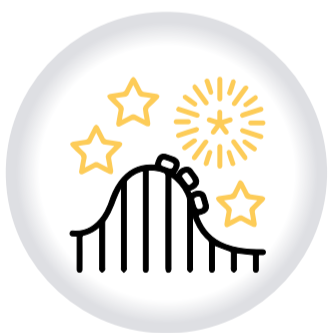
Registro para PARQUES DE DIVERSIONES, ATRACCIONES O DISPOSITIVOS DE ENTRETENIMIENTO