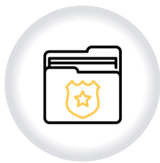
Dirección para la GESTIÓN ADMINISTRATIVA ESPECIAL DE POLICÍA