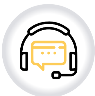
Recepción y trámite QUEJAS Y SOLUCIONES