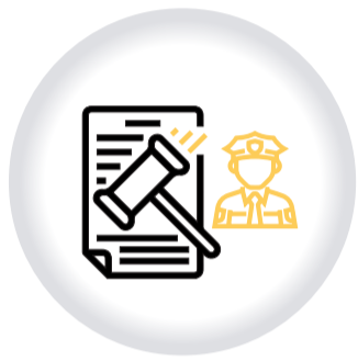
Registro RECURSO DE APELACIÓN COMPARENDOS CNSCC