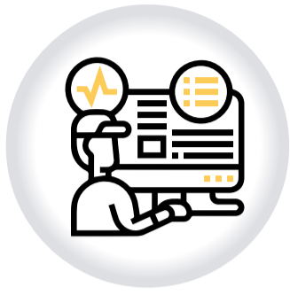
Supervisión DELEGADO DE SORTEOS Y CONCURSOS