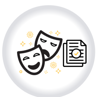
Permiso ESPECTÁCULOS PÚBLICOS DE LAS ARTES ESCÉNICAS