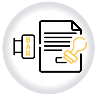
Certifica TU BAR