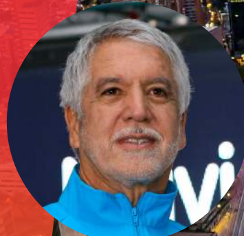
Enrique Peñalosa Alcalde de Bogotá