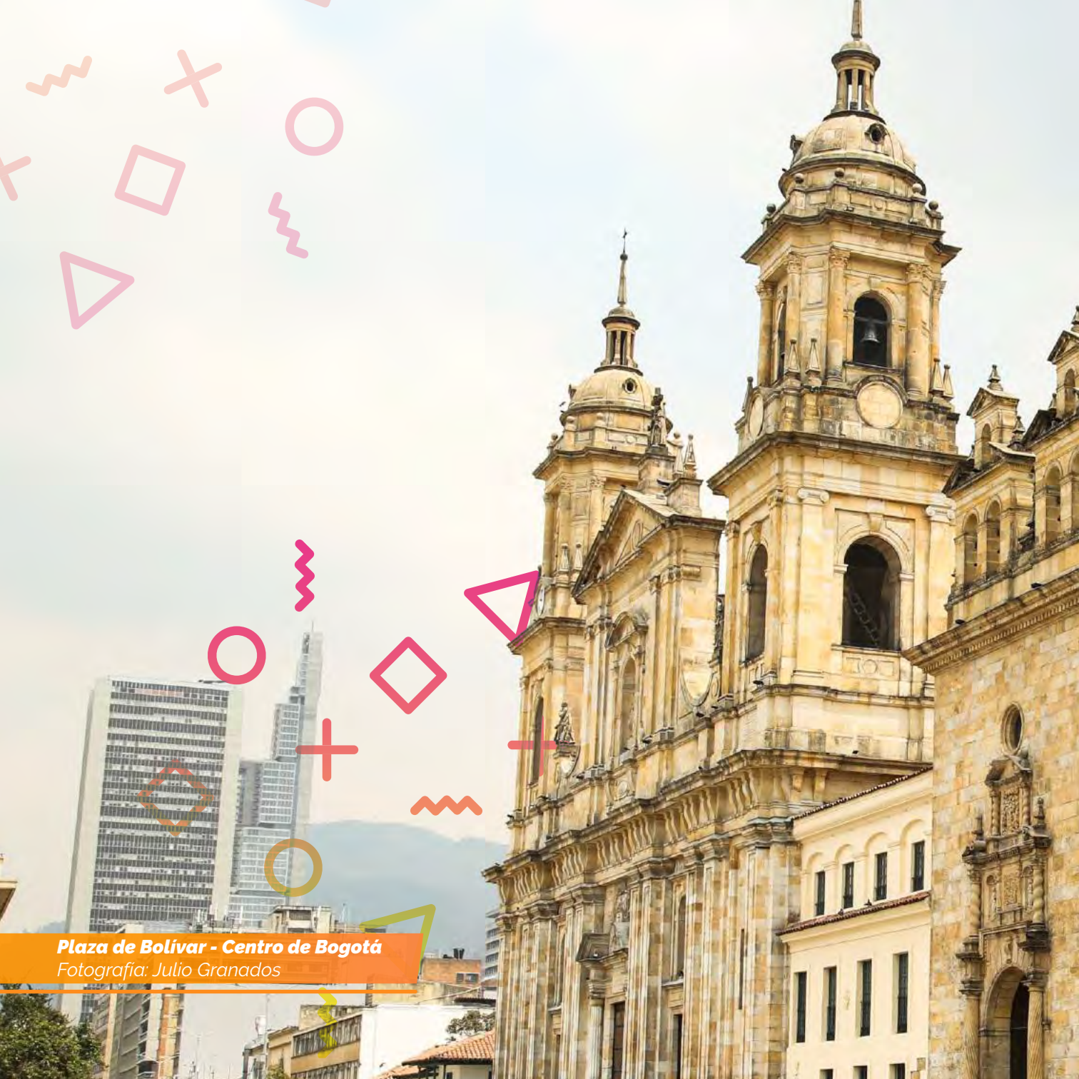
Plaza de Bolívar - Centro de Bogotá