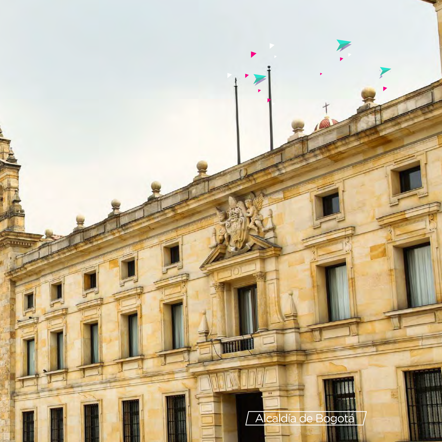
Alcaldía de Bogotá