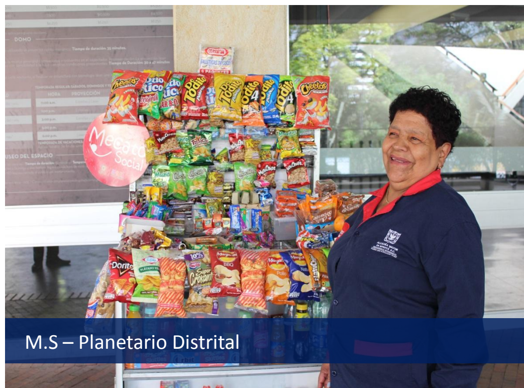
M.S – Planetario Distrital

Tiene como objetivo concentrar recursos técnicos, físicos, administrativos y financieros para la generación de empleo a grupos poblacionales vulnerables como los adultos mayores y las personas en condición de discapacidad.