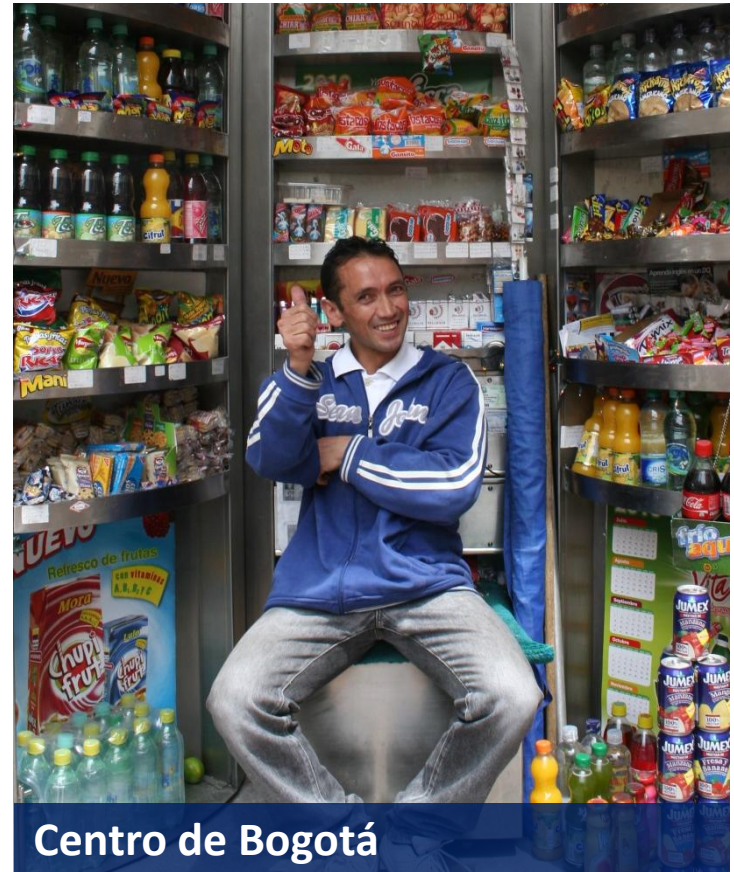
Centro de Bogotá

▶ Son puntos de venta de productos al paso, ubicados estratégicamente en zonas de alto tráfico de la ciudad.