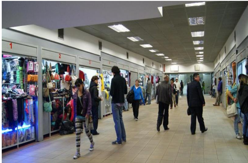
P.C El Túnel