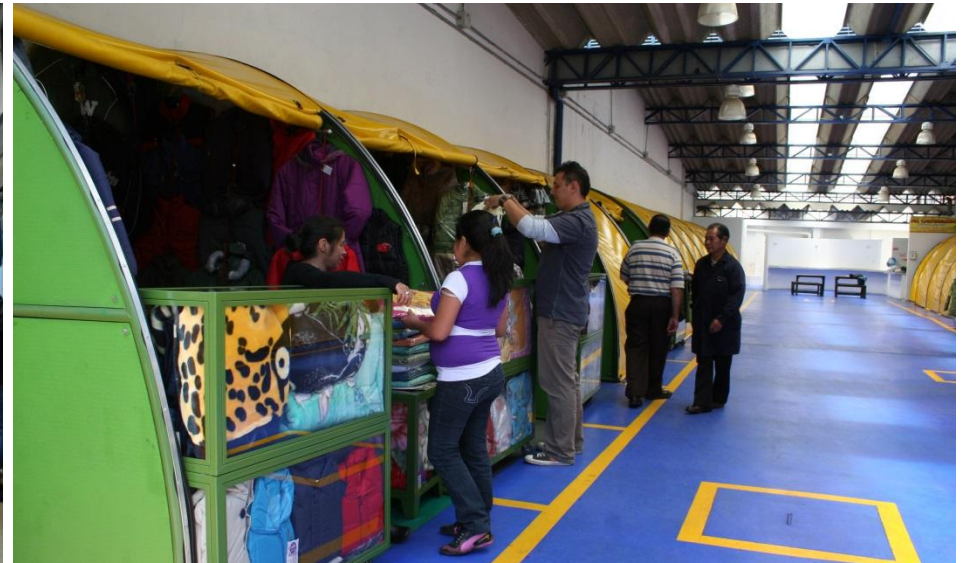
P.C Siete de Agosto

Son alternativas de generación de ingresos, fortalecimiento económico y productivo para hacer viable el ejercicio comercial, la inserción en el mercado y la reubicación de las actividades comerciales o de servicios desarrolladas por los sectores de la economía informal, en espacios adecuados, administrados por el IPES.