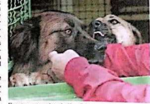
El punto exacto será en el edificio.

Este domingo se realizará una jornada de adopción de mascotas en el centro comercial Gran Estación. El evento busca promover la adopción responsable de mascotas y brindar un espacio para que los interesados encuentren a su nueva mascota. Se tendrán disponibles perros, gatos y otros animales que necesitan un hogar. El evento es gratuito y abierto a todos. El Gobierno Nacional, a través del Ministerio de Salud, lidera esta iniciativa para promover el bienestar animal y la convivencia responsable con las mascotas.