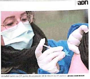
La ciudad cuenta con 27 puntos de vacunación. 14 de ellos en los 19 barrios.

PEDAGOGÍA PARA IMPLEMENTAR LA PREVENCIÓN DE CERCA DE 25 ENFERMEDADES El plan de vacunación arranca este viernes con una jornada de pedagogía y sensibilización en los barrios. El objetivo es informar a la población sobre la importancia de la vacunación y promover la participación activa de la comunidad. Los puntos de vacunación estarán distribuidos en diferentes zonas de la ciudad, facilitando el acceso a los servicios de salud. El plan incluye la prevención de enfermedades como la gripe, el sarampión y la difteria. El Gobierno Nacional, a través del Ministerio de Salud, lidera esta iniciativa para proteger la salud pública y reducir la incidencia de enfermedades prevenibles.