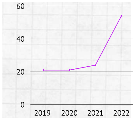
Delitos sexuales Antonio Nariño Enero - Abril

De acuerdo con la información suministrada por la SDSCJ en la localidad de Antonio Nariño se presentó un aumento de los delitos sexuales del 125% entre enero y abril de 2022 en comparación con el mismo periodo del año 2021. En la UPZ Restrepo se presentaron 40 casos para un aumento del 90.5% y en la UPZ Ciudad Jardín se presentaron 14 casos de delitos sexuales para una aumento del 366.7% .