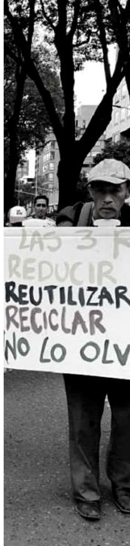
Pulzo (2020). Protesta de recicladores en Bogotá [Fotografía]. Pulzo. https://www.pulzo.com/nacion/protestas-bloqueos-recicladores-norte-bogota-PP854609