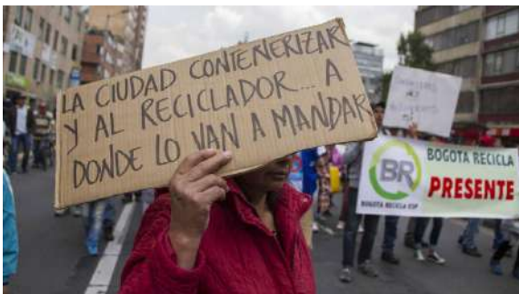
Sierra, J (s.f) La marcha de los recicladores. [Fotografía] https://www.semana.com/la-marcha-recicladores/137225-3/

Este mismo argumento por parte de las organizaciones de recicladores volcó a las calles en el año 2017 a cientos de recicladores de oficio organizados y no, quienes denunciaron en las instalaciones de la UAESP en la localidad de Chapinero, que el Sistema de Licitación Pública de Aseo para la ciudad propuesto por el entonces alcalde Enrique Peñalosa en la licitación pública #02 de 2017, proponía un proceso de contenerización que limitaba el acceso al material aprovechable, prohibía la clasificación en vía pública y desconocía el papel de los recicladores de oficio y su derecho al trabajo digno descatando lo dispuesto por la Corte Constitucional en 2003.