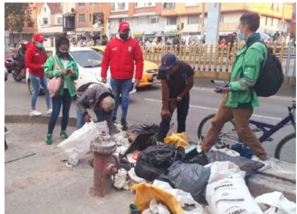
Alcaldía Local de Chapinero [Fotografía] Facebook Oficial Alcaldía Local de Chapinero. https://es-la.facebook.com/AlcaldiaLocaldeChapinero/

La falta de equipamientos destinados a mejorar las condiciones de trabajo y gestión de residuos en la localidad de Chapinero, como la inexistencia de espacios de estacionamiento para los diferentes tipos de vehículos de reciclaje y de estaciones de clasificación y aprovechamiento (ECA) señaladas en el decreto 596, los recicladores se ven obligados a separar los materiales en el espacio público, generando puntos críticos y de acumulación, en su mayoría en parques y bahías de la localidad, o se ven forzados a trasladar los residuos de una localidad a otra, bien sea a bodegas o a sus lugares de residencia. En estos recorridos, algunos de los recicladores participantes señalaron que la incorporación de nuevos actores con quienes se disputan las rutas ha generado amenazas e intimidación y la pérdida del respeto por las recorridos tradicionales, pues entre los recicladores de oficio mantenían acuerdos de quienes y por cuales lugares realizaban sus recorridos, pero en la actualidad, los enfrentamientos con habitantes de calle, carreteros y migrantes han generado tensiones que reflejan que su labor ya no es segura, aumentando los riesgos de su seguridad física y por ende precarizando su labor diaria.