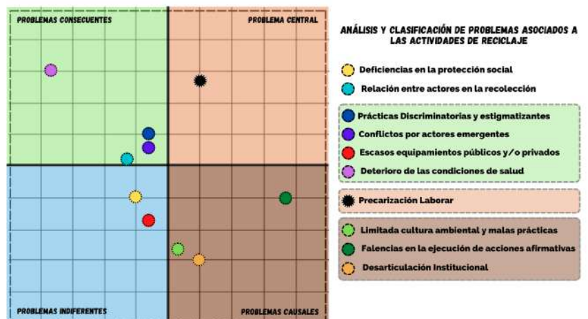
Gráfica 1. Priorización de problemáticas identificadas, elaboración propia.

En este proceso, se observó la desconfianza que tienen los recicladores de oficio ante las entidades distritales, logrando la participación de un (1) líder del gremio en la localidad y catorce (14) recicladores de oficio que hacen parte dos (2) organizaciones. Finalmente, con la información suministrada por los recicladores, la revisión de fuentes y el marco normativo se construyeron 35 situaciones negativas asociadas a las actividades de aprovechamiento que desarrollan los recicladores de oficio en la localidad. Estas se agruparon temáticamente, logrando construir 10 meta problemas, los cuales se analizaron desde un enfoque sistémico en metodología vester y árbol de problemas, arrojando así, el problema estructural, los problemas causales y los problemas consecuentes de esta situación.