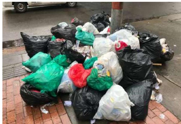
RCN Radio. (2018). Acumulación de basuras [Fotografía]. RCN Radio https://www.rcnradio.com/bogota/cuatro-localidades-de-bogota-con-problemas-de-recoleccion-de-basura

En los edificios colocan dos o tres canecas, esta para las basuras, esta para los residuos peligrosos, esta para el recicle, pero hay gente que echa en donde no es, entonces hay mala separación y por eso es que se han sacado muchas bolsas: que la verde, que la blanca, que la roja para eso, pero a la mayoría no le interesa eso, ¡a donde caiga allá lo botan! Y por más que se haga la sensibilización, que los acompañamientos, que vamos a hablar con el administrador o administradoras (inaudible) ¡eso no sirve! (Anónimo, comunicación personal, 11 de octubre de 2022).